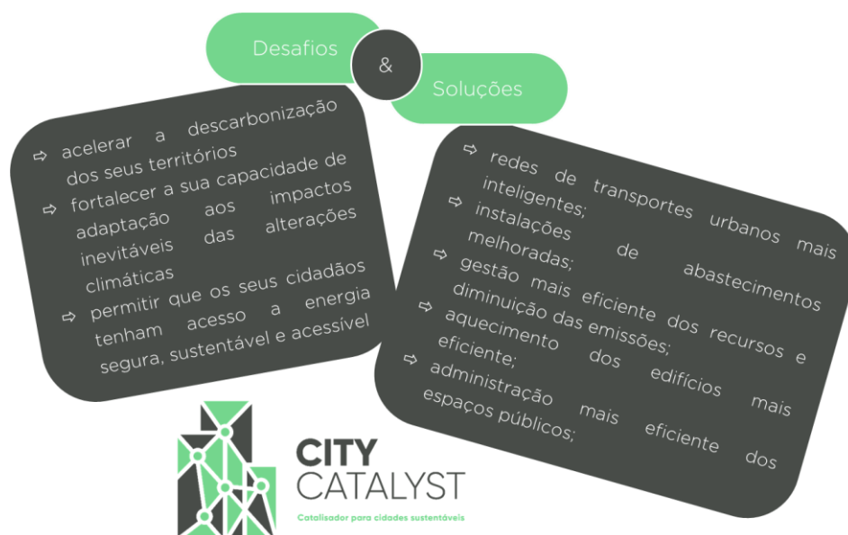
Fig. 1 – Desafios e soluções identificados no âmbito do projeto City Catalyst.

O projeto mobilizador “City Catalyst – Catalisador para cidades sustentáveis” visa investigar e desenvolver novos produtos, processos e serviços com elevado potencial, contribuindo para uma gestão urbana integrada, eficiente e catalisadora da inovação, a partir de contribuições específicas para a implementação e interoperabilidade das plataformas urbanas.